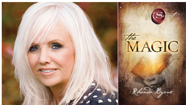
รอนดา เบิร์น (Rhonda Byrne)

เช่นกัน กลับกัน หากเราไม่เคยกอดดู หรือไลค์คนคนหนึ่งเลย ในไม่ช้า ฟี ดของคนที่เราจะค่อยๆ หายไป... นั่นเพราะเรามีเพื่อนเยอะเกินกว่าที่จะ รับรู้ฟีดทั้งหมดของเพื่อนทุกคนได้